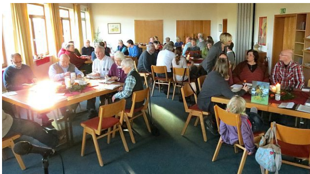
Abbildung 7: Großer Saal im Gemeindehaus. Hier gibt es auch eine Küche, sowie Jugendräume und Besprechungszimmer

Das Gemeindehaus auf dem Kohlhof wurde 1985 errichtet und später erweitert. Es dient heute als Gemeindezentrum und wird auch gerne für regionale und überregionale Veranstaltungen genutzt. Im Winterhalbjahr finden hier auch die Gottesdienste statt.