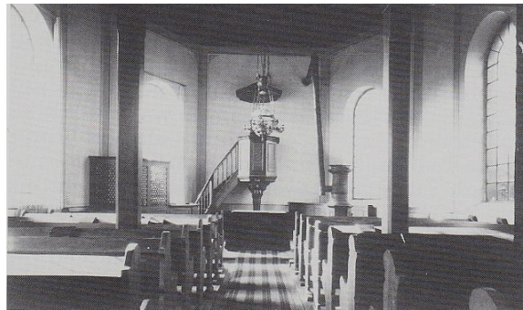
Abbildung 5: Innenansicht der Kirche 1926

Für das Jahr 1791 wird berichtet, dass sich 70 Menschen zu einem Gottesdienst in Privaträumen auf dem Kohlhof versammelten. Inwieweit dies Rückschlüsse auf die Zahl der Gemeindemitglieder ermöglicht, ist ungewiss. Das mennonitische Adressbuch gibt im Jahr 1936 eine Zahl von 37 getauften Mitgliedern an. Für das Jahr 2014 werden im Mennonitischen Jahrbuch 87 Mitglieder genannt.