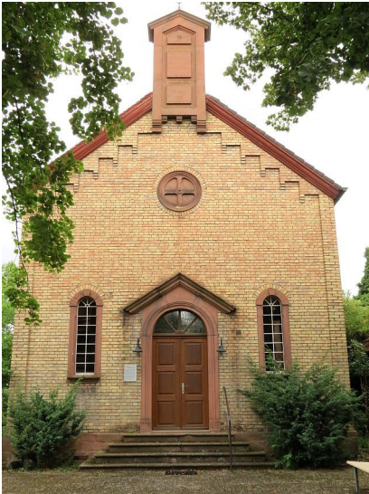
Abbildung 4: Die mennonitische Kirche im Jahr 2014

Architektonisch gibt es zwischen der Kohlhöfer Mennonitenkirche und der im Jahr 1892 eingeweihten Schifferstadter Synagoge zahlreiche Parallelen. Der Grund dafür liegt darin, dass beide Planentwürfe von dem selben „Bezirksbauschaffner“ erstellt wurden. Die Synagoge in Schifferstadt wurde 1938 bei der „Reichspogromnacht“ zerstört.