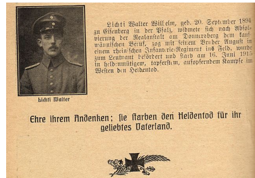
Abbildung 6: Aus dem "Christlichen Gemeindekalender 1917", herausgegeben von der "Konferenz der süddeutschen Mennoniten"

Nationalismus und die damit gelegentlich verbundene Kriegsbegeisterung ging auch an den Kohlhöfer Mennoniten nicht spurlos vorbei. 1871, nach dem gewonnenen Krieg gegen Frankreich und dem Inkraftsetzen einer Reichsverfassung, die auch den Mennoniten Bürgerrechte gab, wurde beim Anwesen Kohlhof 8 eine „Friedenslinde“ gepflanzt, die wohl eher eine „Siegesslinde“ war. Nationalstolz und Vaterlandsliebe der deutschen Mennoniten lassen sich gut am „Christlichen Gemeindekalender“ von 1917 darstellen, in dem der Toten des I. Weltkrieges gedacht wird. Auch für den Nationalsozialismus gab es bei den Kohlhöfer Mennoniten Sympathien. Die Gegner Hitlers schwiegen notgedrungen. Eine Rückbesinnung auf die täuferischen Traditionen erfolgte wieder nach dem II. Weltkrieg.