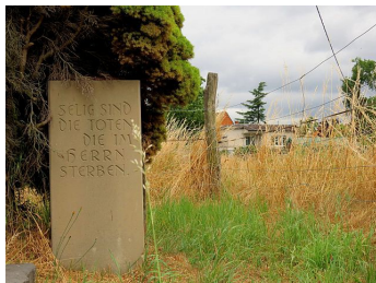
Abbildung 2: Begräbnisplatz auf dem "Grasplätzchen"

Gulden, später von 12 Gulden je Familie zahlen. Als den Mennoniten seit 1726 auch der Grunderwerb möglich wurde, sollten „die Christen Vorzug vor den Wiedertäufern haben“.